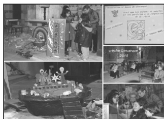
Crèche de Noël