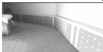
Travaux dans la sacristie

Nous avons reçu avec beaucoup de plaisir les visiteurs sensibles à la proposition offerte, tant au niveau de la crèche que du « jeu de piste ».